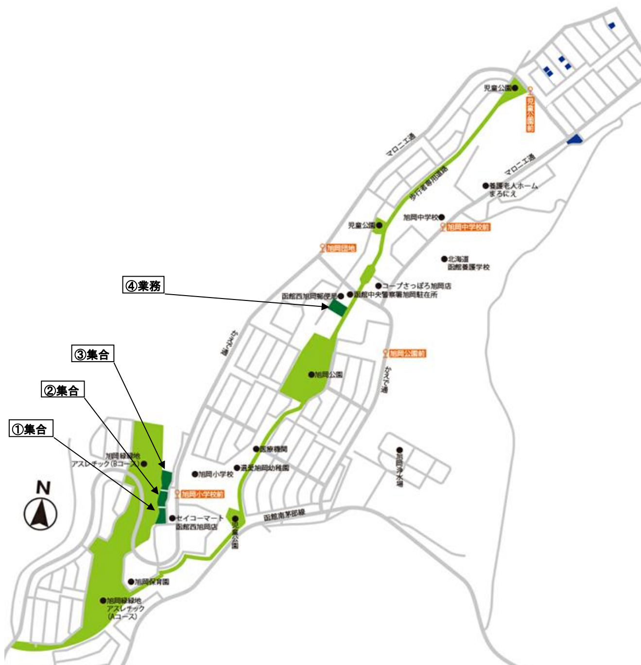
集合・業務用地データ