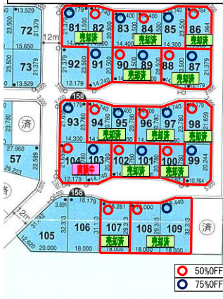
【きた住まいるヴィレッジ(美園4丁目)】