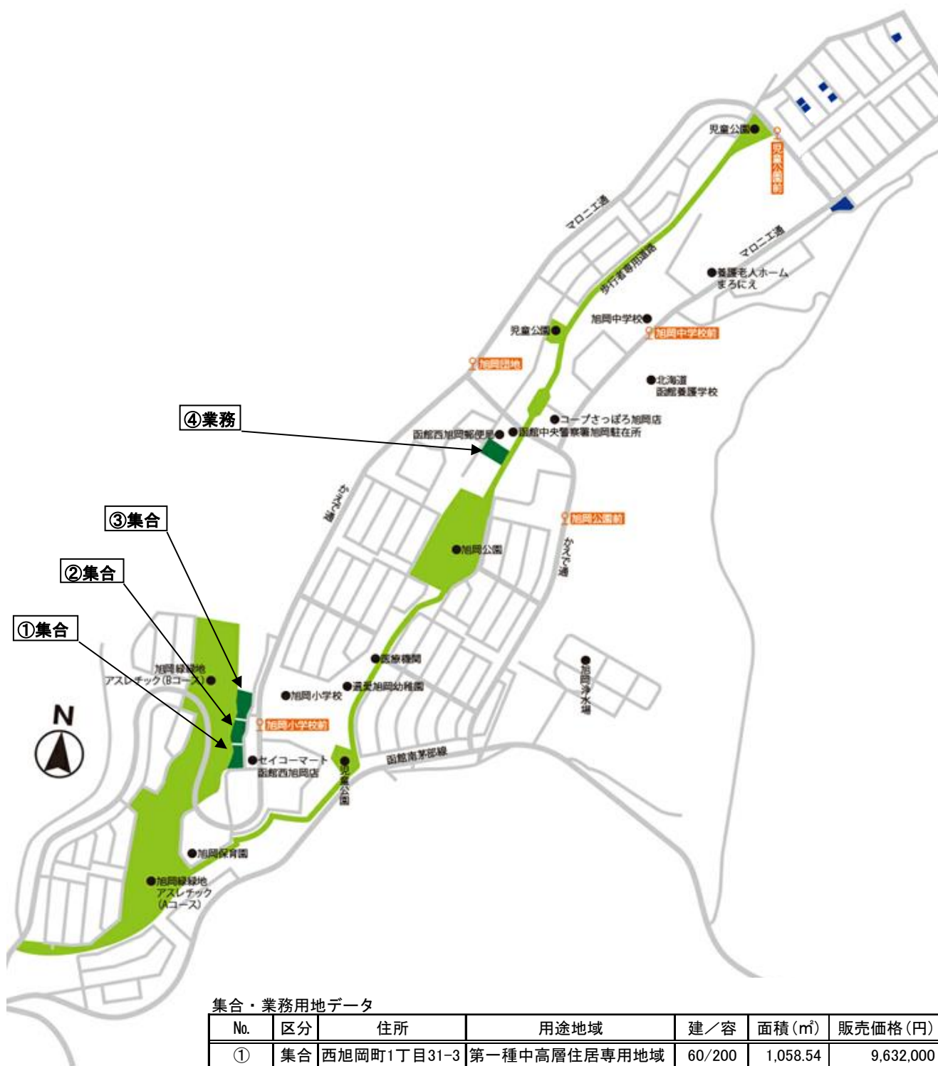
集合・業務用地データ